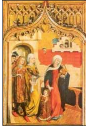
Szent Erzsébet gyermekeivel elhagyja Wartburg várát

Házasságuk rövid ideig tartott, mert Lajos 1227-ben a szentföldi keresztes hadjáratba igyekezvén, még hajóra szállás előtt Itáliában megbetegedett és meghalt.