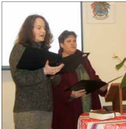
A sárbogárdi evangélikus gyülekezet szolgálói, nők

Ebben az esztendőben február 27-től gyűltünk össze estéről-estére római katolikusok, evangélikusok, reformátusok, a Kálozi Református Egyházközség gyülekezeti termében, hogy egy-egy fiatal lelkes vezetésével közösen figyeljünk Isten igéjére, együtt imádkozzunk szereteteinkért, közösségeinkért, népünkért.