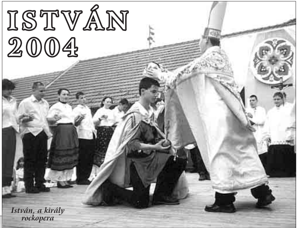
István, a király rockopera

A fiúknál a 6. és 7. osztályos csapatunk nagyon szép, okos játékkal megszerezte a kupát a szintén kiválóan játszó ötödikesek előtt.