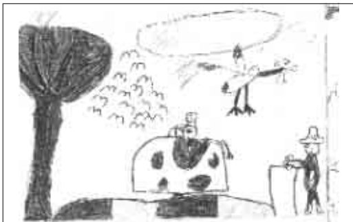
Ács Bálint rajza