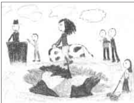
Bartos Dóra rajza